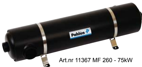
Art.nr 11367 MF 260 - 75kW